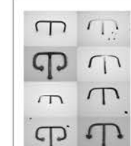
"Neige", assemblage de 8 photos noir et blanc, 2011.