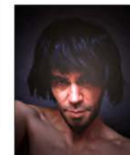
"Là où je vais la nuit", auto-portrait, 1999.