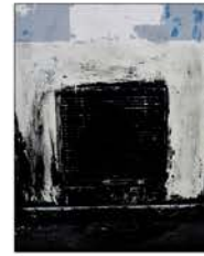
"Peintures trouvées", deux photographies couleur 2012